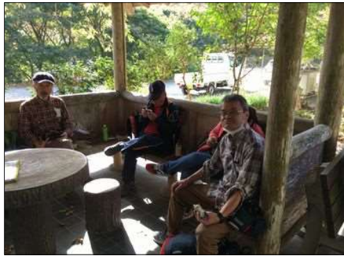
8 誰かさんが隠れた!