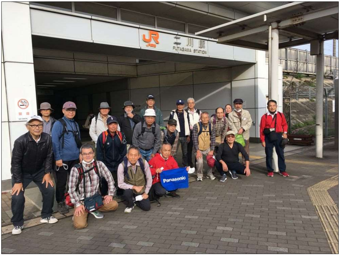
19 無事元気で二川駅にゴール！お疲れ様でした