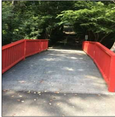
14 大師堂の入口の赤い欄干