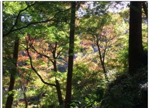
17 ちょっと早い紅葉