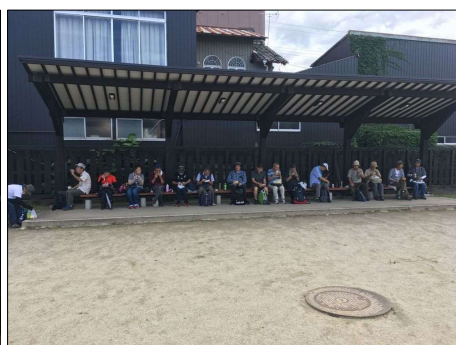
57 コロナ禍での昼食風景