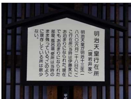
23 明治天皇行在所の説明文