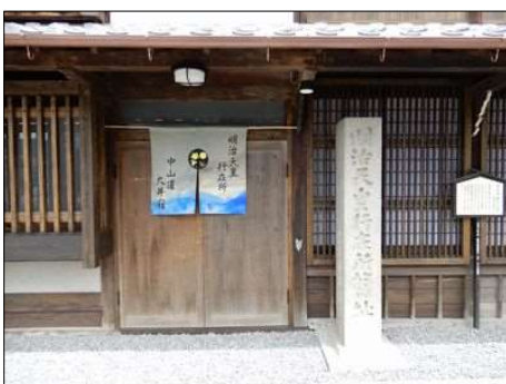
22 明治天皇専用の玄関