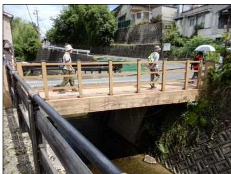
26 中山道に架かる古い橋