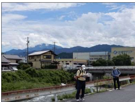
35 現在地を確認し、行程チェック