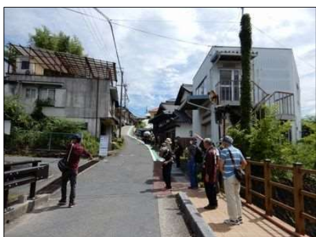
28 道幅が狭い中山道