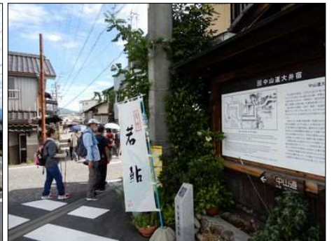
9 いよいよ中山道を歩く