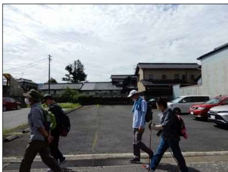
10 元気よく歩き出す