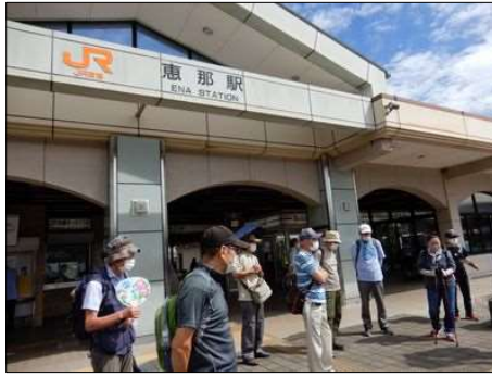
3 青空の下18名がご参加