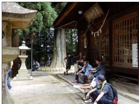
31 暑い中暫しの休憩