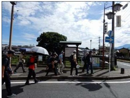
8 日差しを日傘で遮る