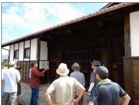
17 とても大きい柱の長屋門