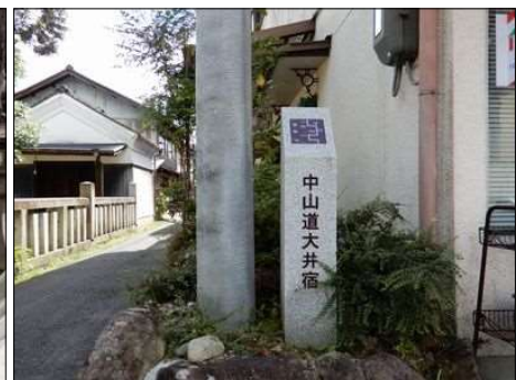
12 中山道大井宿の案内