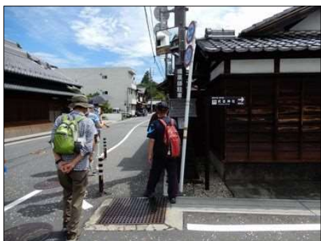
24 町並がノスタルジー