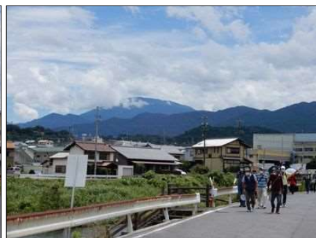
36 遠くに恵那山が見える