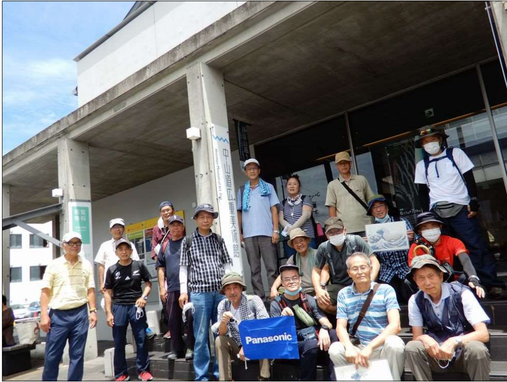
40 無事元気にゴール！お疲れ様でした(中山道広重美術館前)