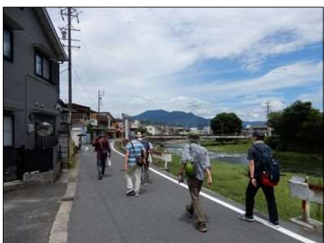
37 ゴール真近で足取りも軽やか