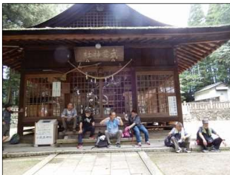
32 皆さん暑い中お疲れ様