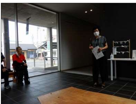
38 中山道広重美術館にて説明