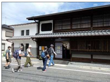
16 明治天皇大井行在所に到着