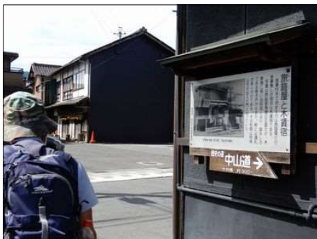
14 大井宿のキッチン宿の説明