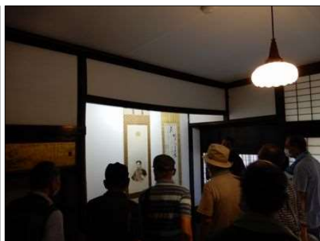
18 明治天皇の大井宿での寝室