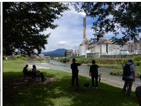
33 阿木川の河原にて