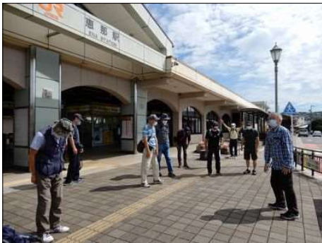
7 恵那駅前で体をほぐす