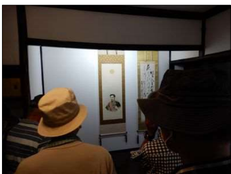
21 大きな1枚板の欄間もある