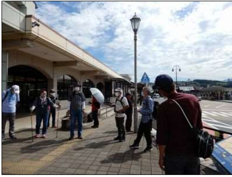
2 恒例の出発前のミーティング