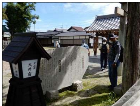
11 大井宿の昔の街灯