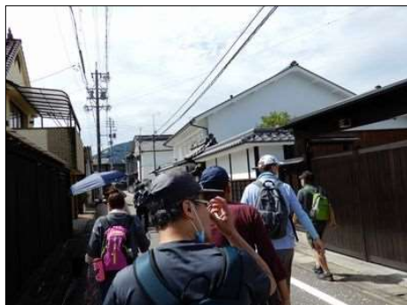
13 大井宿の街並みが続く