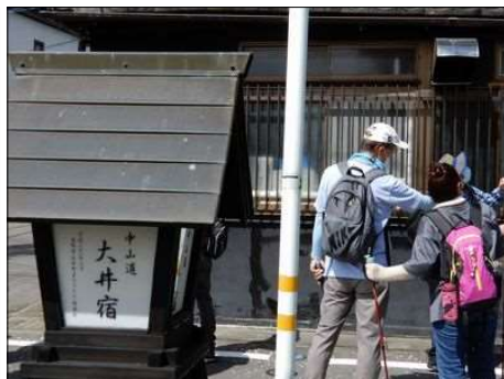
15 あちこちに大井宿の街灯が