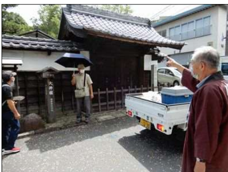
25 大井宿の本陣の山門にて