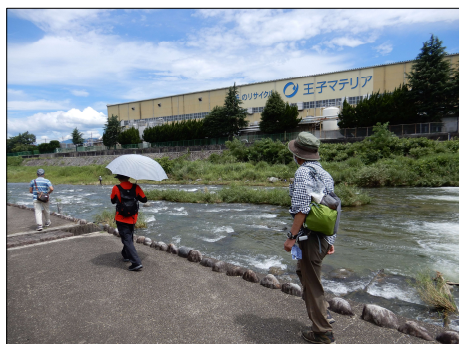
34 水の音で癒される