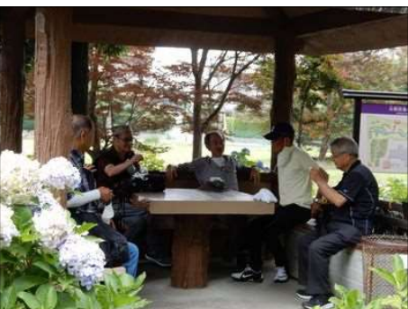
3368 久しぶりで話が弾む