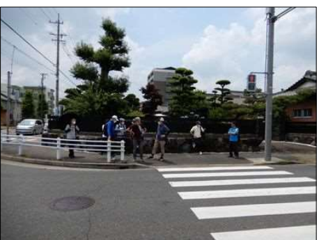
3380 交通ルールを守って