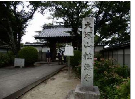
3366 大塚性海寺の入口