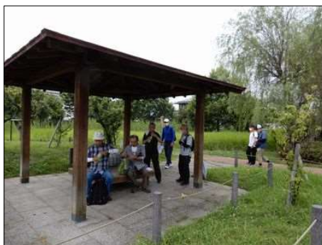
3362 長束・梅公園にて