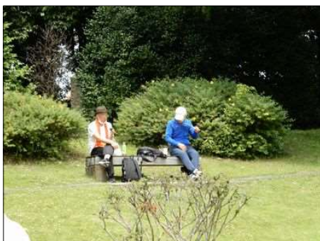
3374 コロナ禍でスタンスを取る