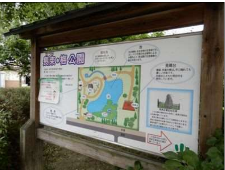
3365 長束・梅公園の概要看板