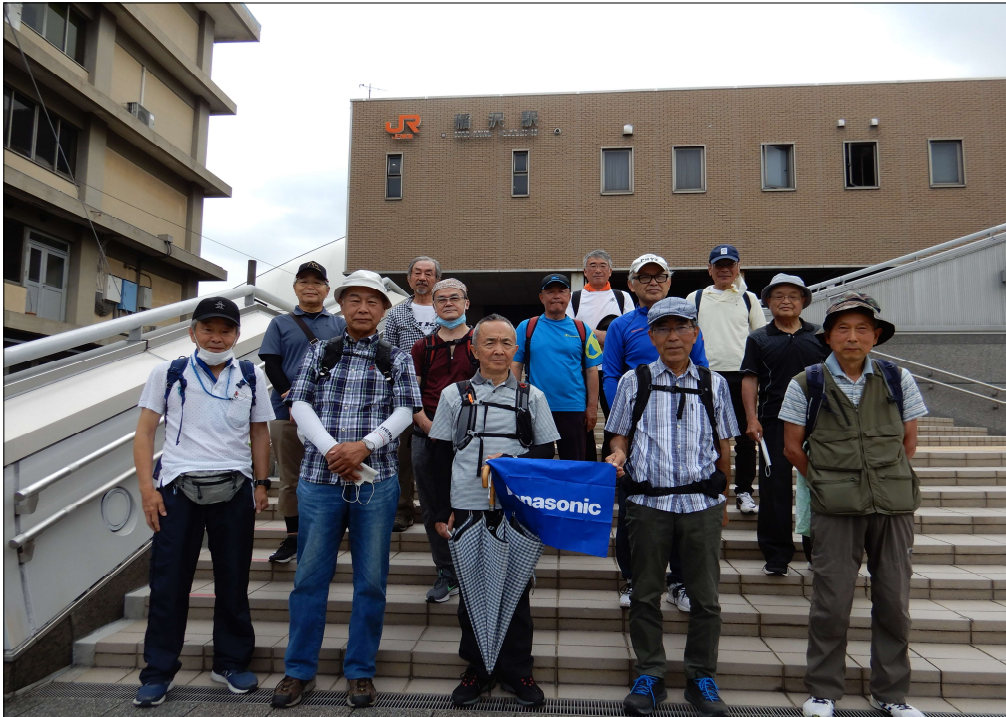
3361 JR稲沢駅を13名で元気にスタート