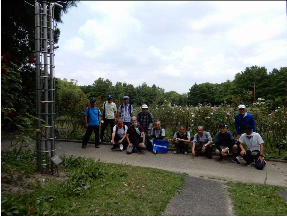
3377 稲沢公園のバラ園前で