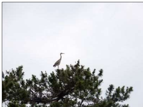
3370 大きな木の上にサギが