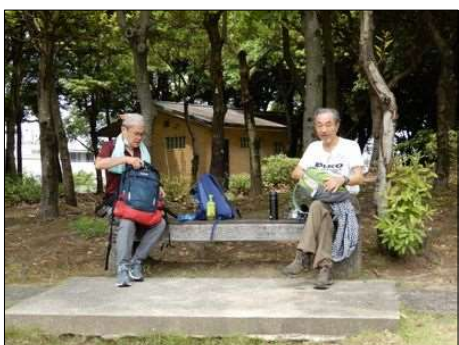
3376 しっかり距離を置く