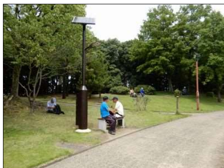
3373 密にならない食事風景