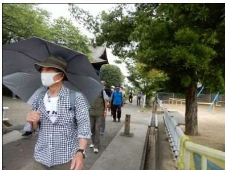
3371 大塚性海寺を後にして