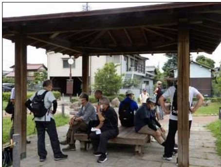
3364 久しぶりで話が弾む