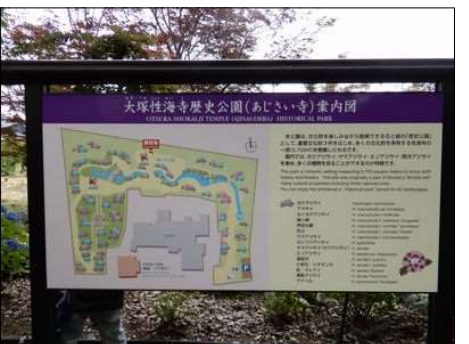
3369 大塚性海寺の地図