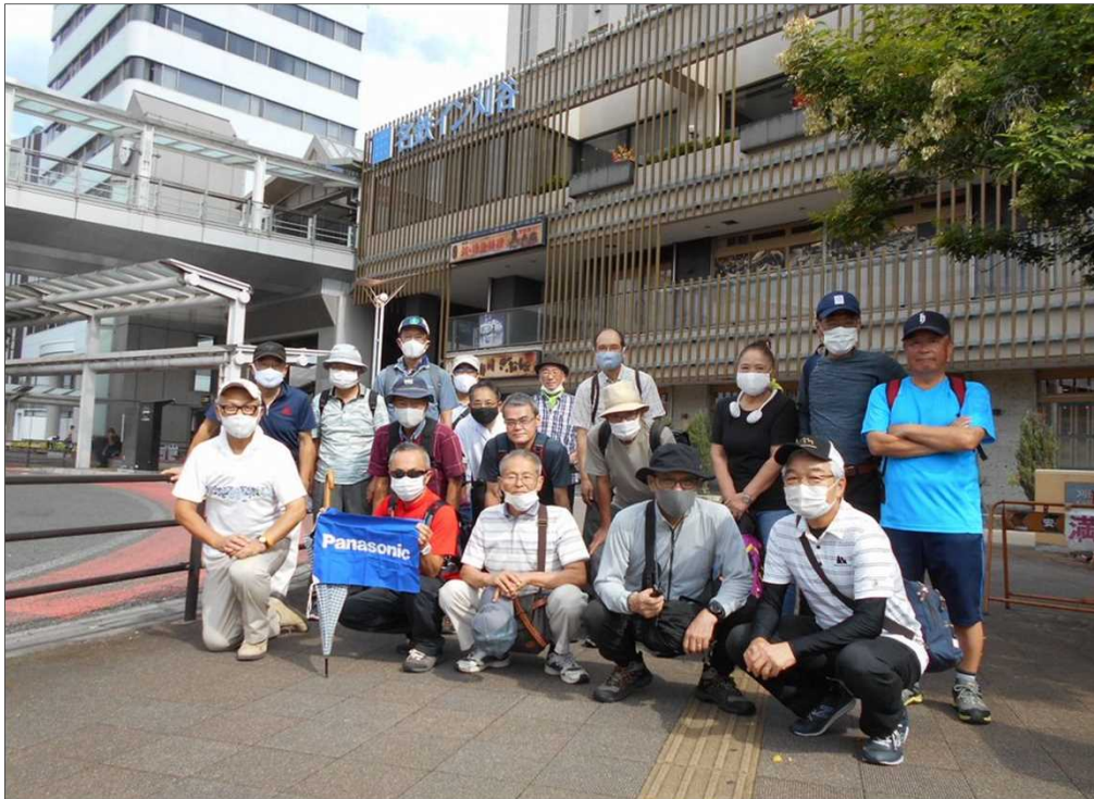
1511 JR刈谷駅を19名で元気にスタート