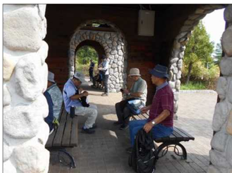
1516 久しぶりに会話を楽しむ