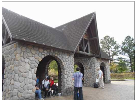
1515 おしゃれな休憩所で