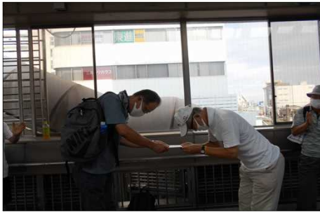
1508 清水支部長から古希祝い頂く