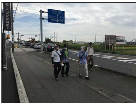
381 最後尾Gはゆっくりと