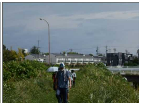
1518 青空の下、コスモス畑は？