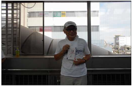
1509 西村への古希祝い