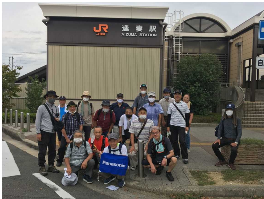
25 無事元気にゴール！お疲れ様でした(JR逢妻駅)