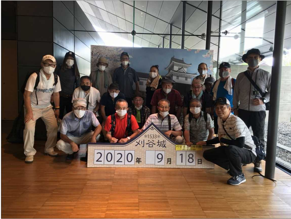
419 刈谷市歴史博物館