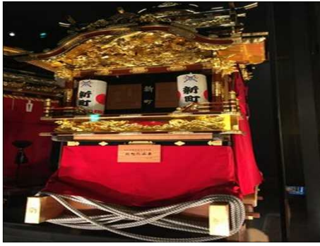
400 大きくて華美な山車