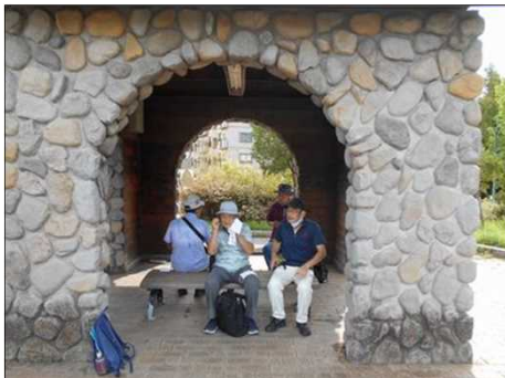
1513 ミササガパークで休憩