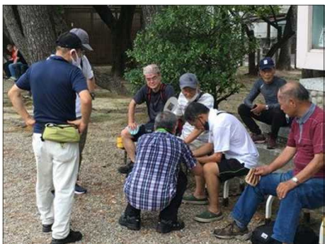
374 臨時スマホライン教室