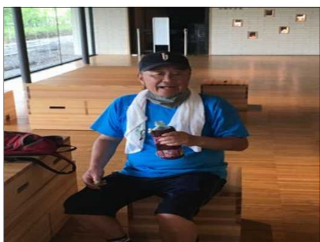
390 藤井さんは片手に？