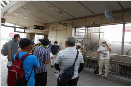
1507 刈谷駅の通路でコース説明