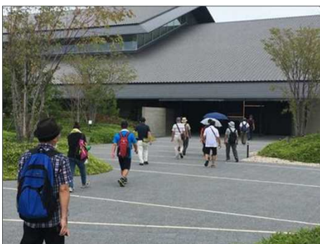
382 刈谷市歴史博物館に到着