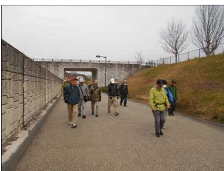
1398 公園西駅に向かう