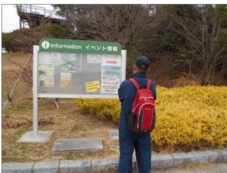
1393 藤井さん 行動計画検討中！