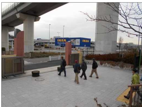
1402 いよいよゴールに近づく