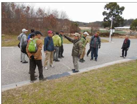
1380 モリコロパークに到着