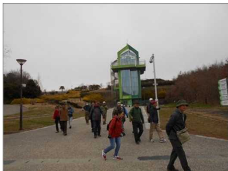
1383 モリコロパークを散策