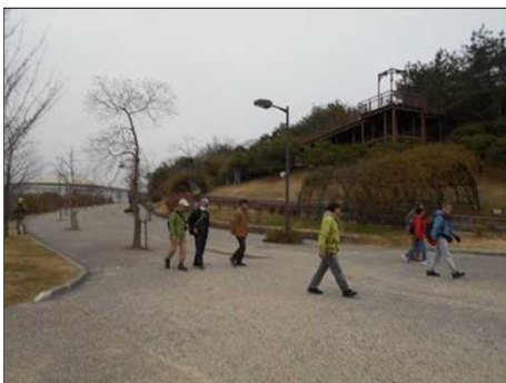
1390 やっと休憩タイムが来た！