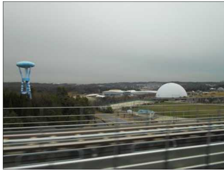
1410 リニモからモリコロパークへ