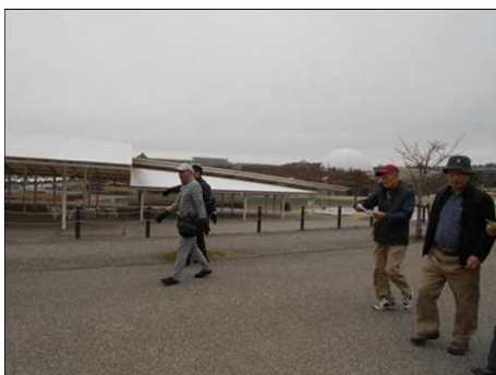
1387 幅広い歩道を歩く