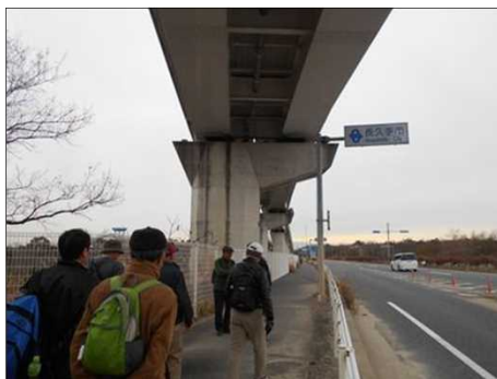
1378 リニモの下を歩く