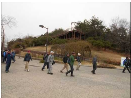
1389 西口休憩所に向かう