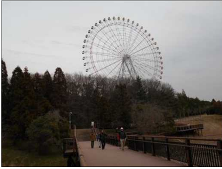
1405 みんなで一緒に乗ろう！