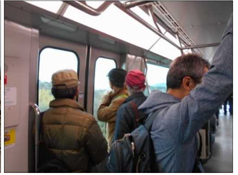
1407 リニモの車窓から眺める