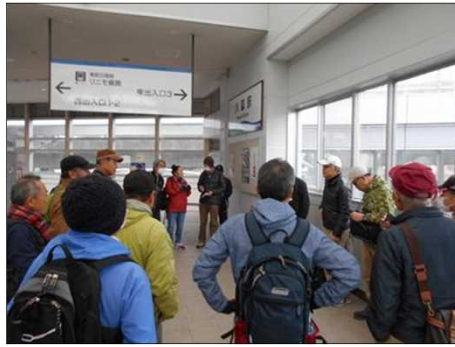
1372 出発前の連絡と報告