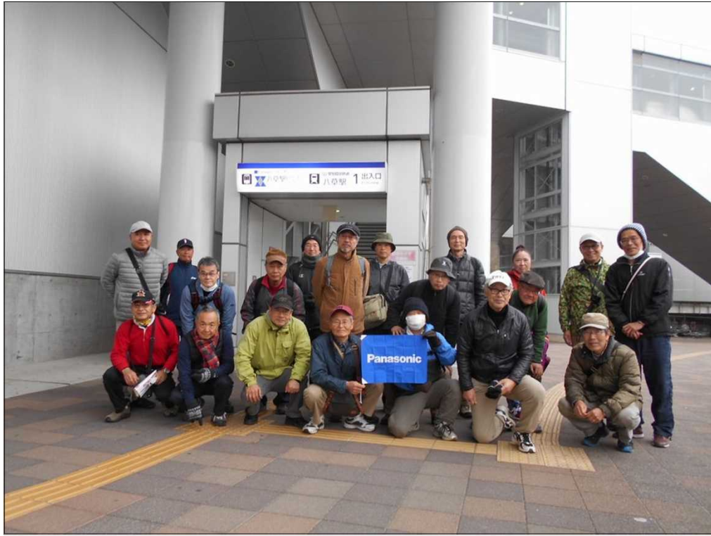
1374 愛環 八草駅を21名でスタート