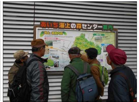
1375 さて今日のコースは？