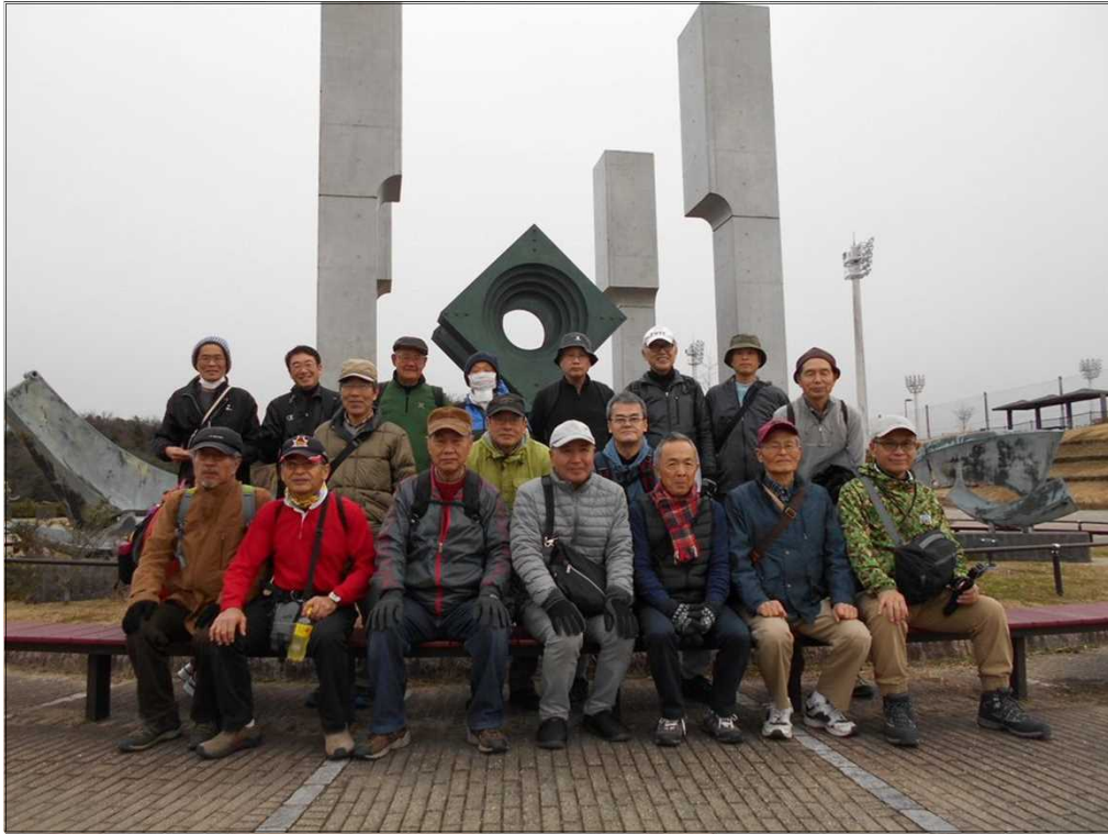
1397 大きなモニメント前にて