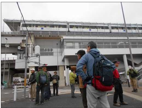
1376 スタート地点に集まった