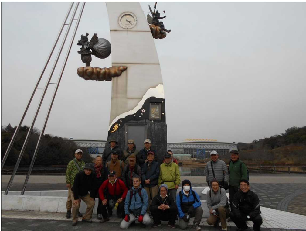
1399 シンボルの時計台にて