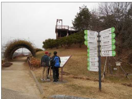
1391 パーク内の案内板を見る