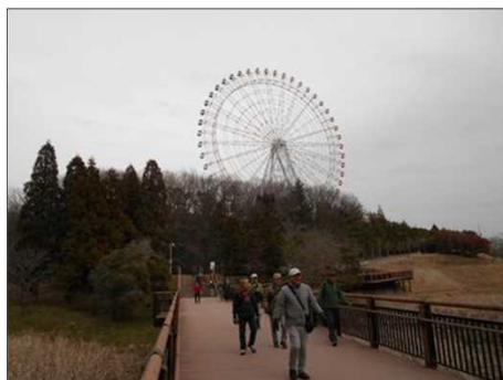
1403 大観覧車が動いていた