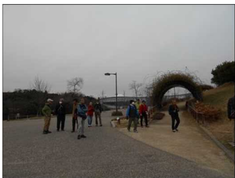
1392 来場者が殆どいない