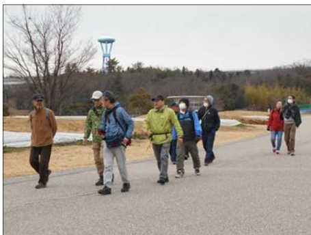
1384 歩こう会の貸切状態