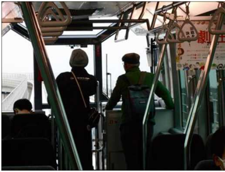
1408 子供時代にタイムスリップ