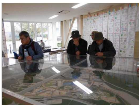
1395 昔話で盛り上がる