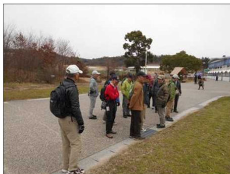
1381 チョコボラの現場を見学