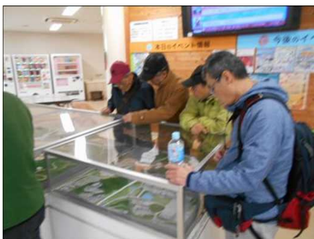
1394 休憩所内の模型で振り返る