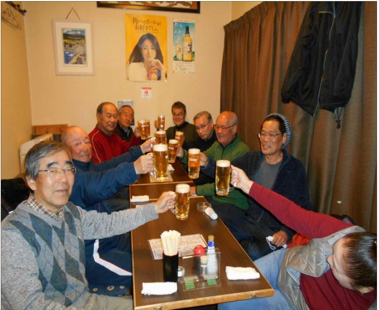
1411 高蔵寺駅前の居酒屋で新年会