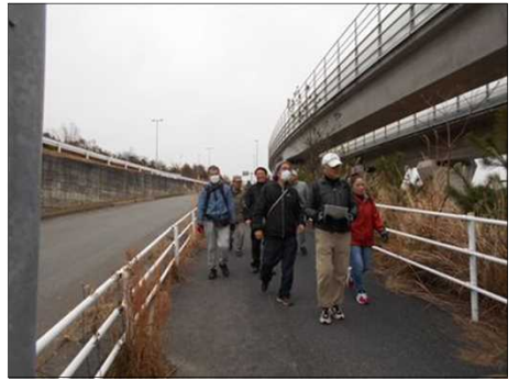
1379 ようやく上り道が終わった