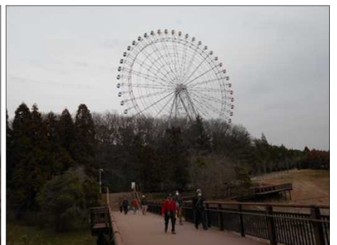
1404 観覧車に乗りたいなあ