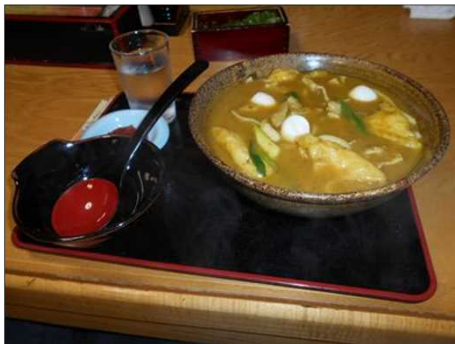
1255 名物「豊橋カレーうどん」