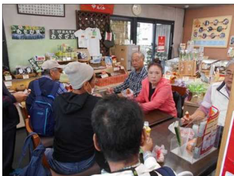
1257 「ヤマサちくわ」で休憩