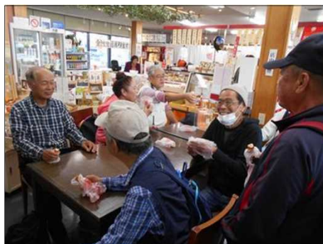
1258 出来立ての暖かい竹輪を食す