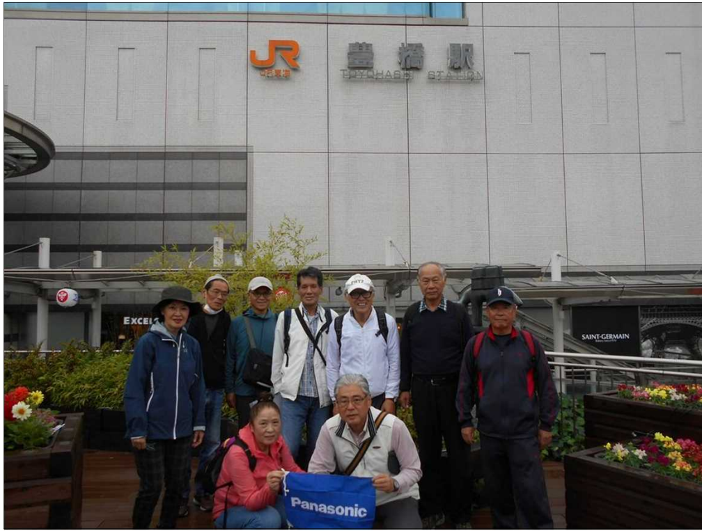
1250 JR 豊橋駅到着、10名でスタート