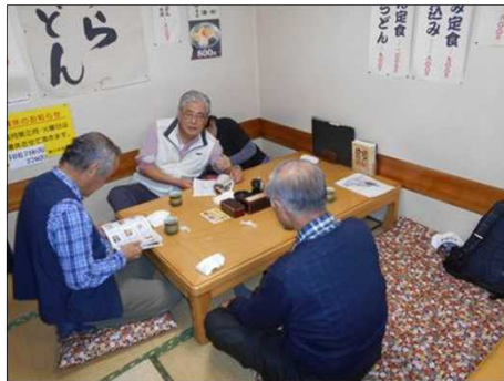
1252 隠れているのは誰かな?