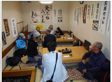
1253 名店「勢川 本店」でうどんを