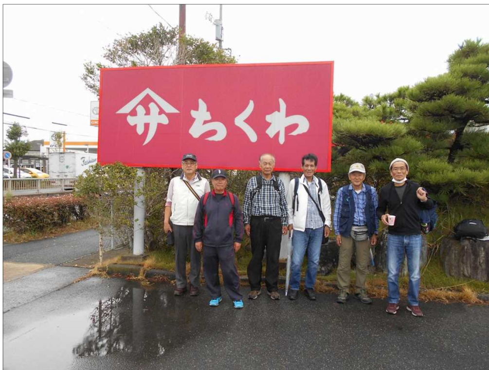
1261 ぐずついた天気の中、お疲れ様でした(ヤマサちくわ(株)前にて)