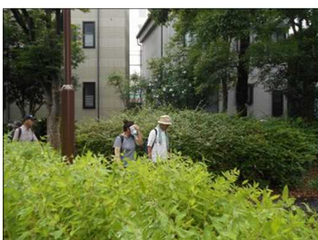
1199 すいどうみち緑道を進む