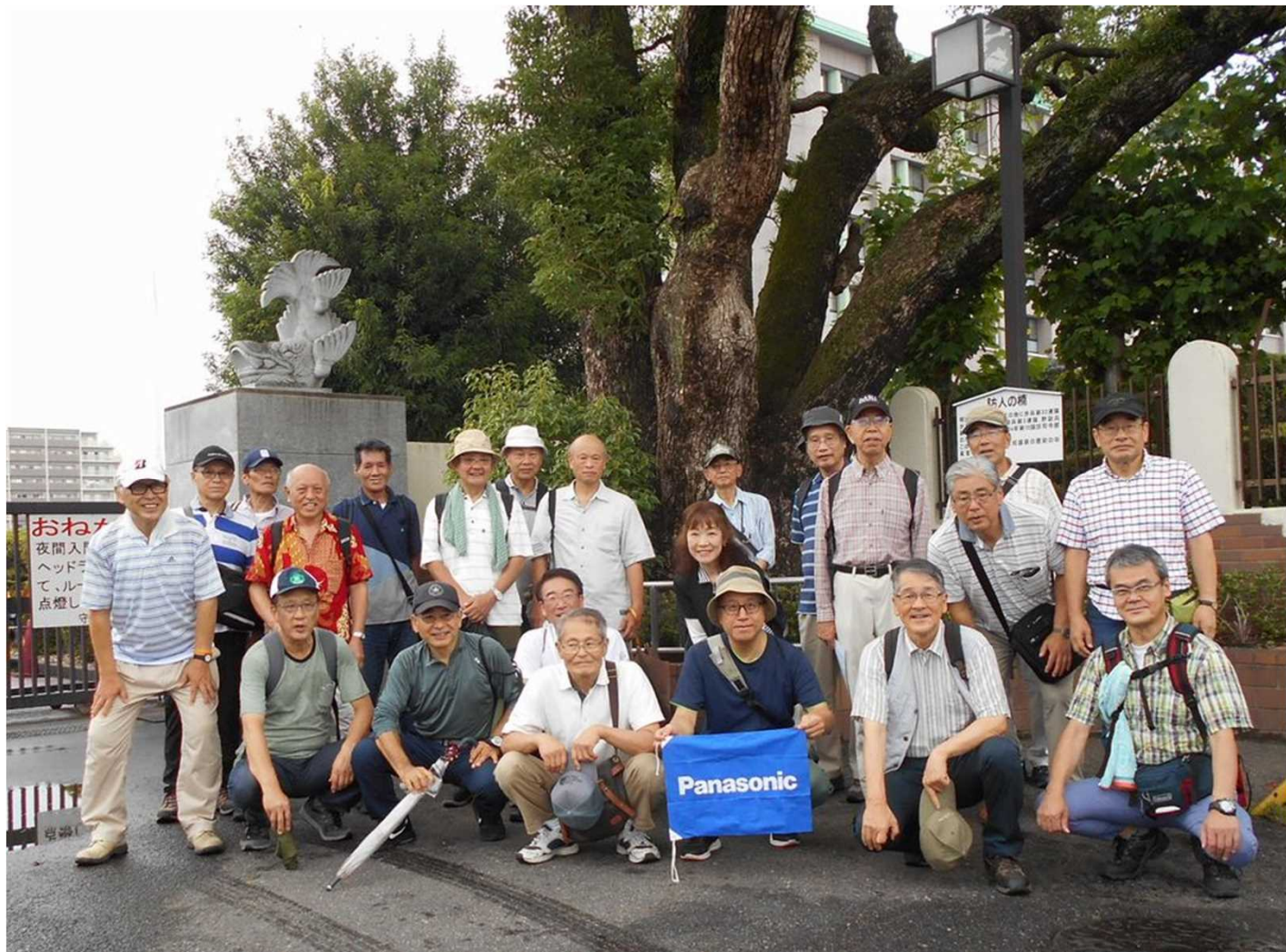
1191 守山自衛隊 正門前にて全員撮影