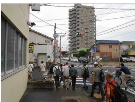
1197 自衛隊の外周を巡る