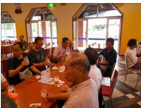
1221 出来立てビールで顔が綻ぶ