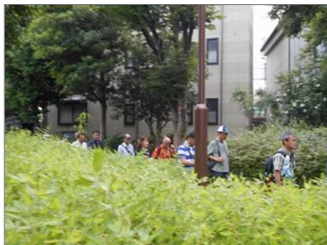
1200 緑道歩きは気持ちいい！