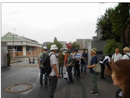
1192 自衛隊正門前にて