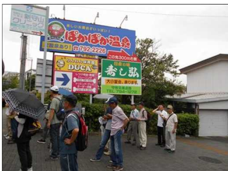
1184 信号待ちで一息つく