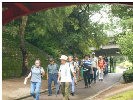
1208 気持ちいい散歩道