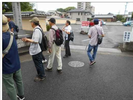
1214 後続部隊も大永寺に到着