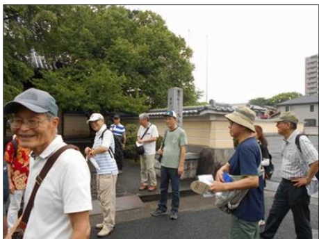
1212 大永寺に着くも心はいずこ？