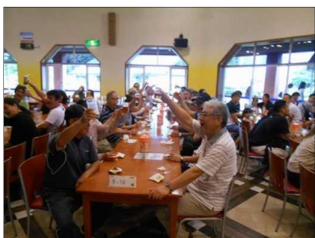
1218 アサヒビール試飲会場で乾杯