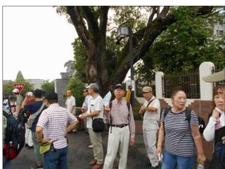
1195 防人の木(楠)の前で