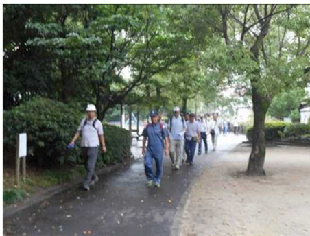
1202 7月とは思えない涼しさ