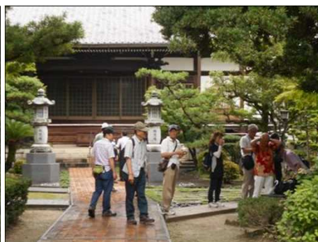
1217 暫しの休憩を楽しむ