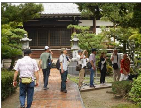
1216 境内にある立派な大きな木