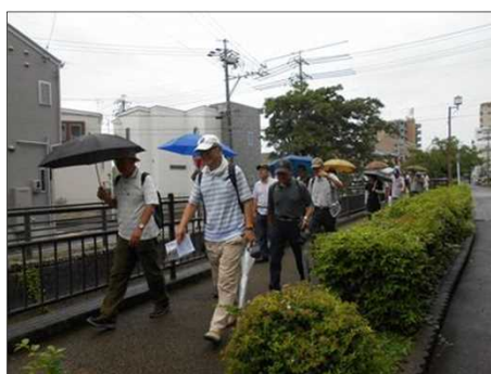
1177 小雨の中、緑道を進む