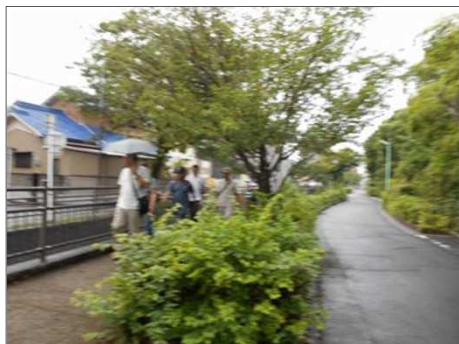
1180 7月とは思えない涼しさ！