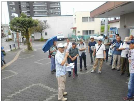
1162 本日の予定等を説明