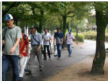
1205 木陰歩きは清々しい