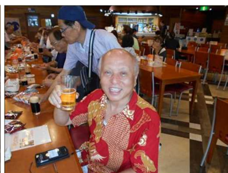
1223 オリンピックの準備を忘れる？