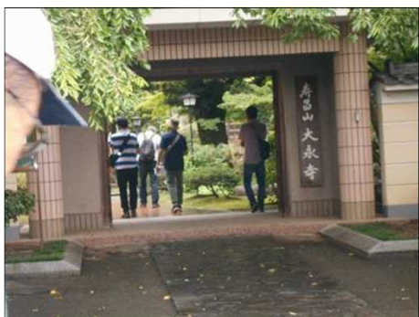
1215 コンクリート製の頑丈な山門