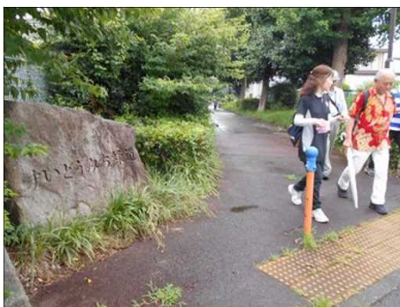
1210 すいどうみち緑道の碑が