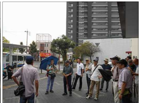
1166 説明を聴いて頂く