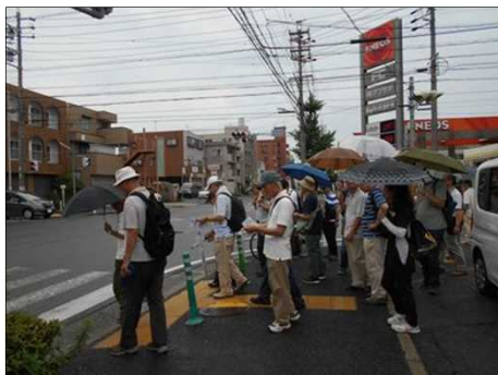
1182 信号待ち、ルールを守って