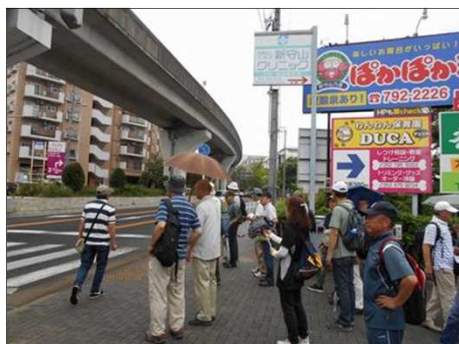
1183 ゆとりーとラインの下を進む