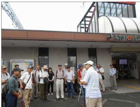
1164 さすがに25人は多い