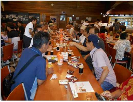
1224 やっぱりビールで話が弾む