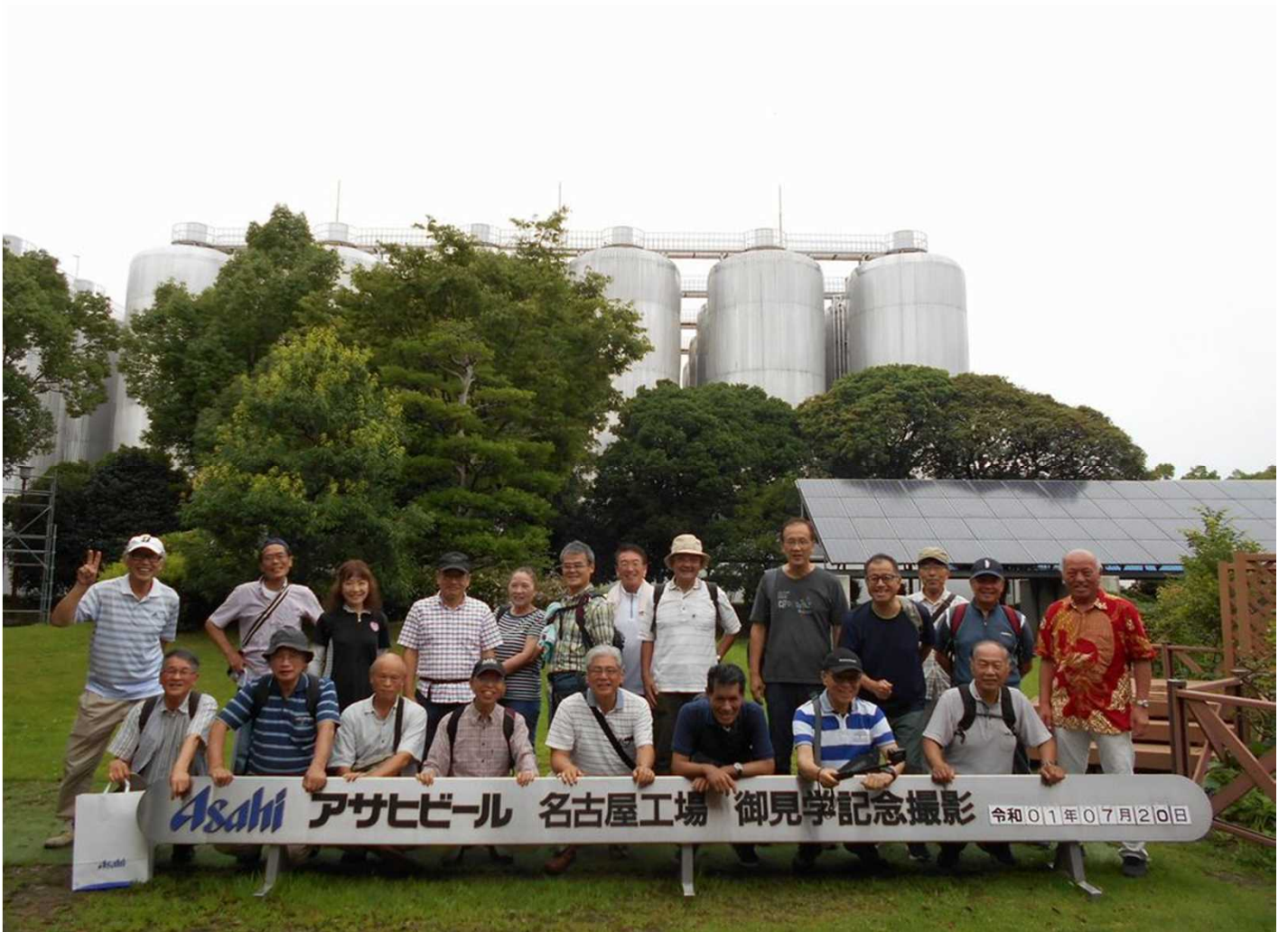
1226 アサヒビール 名古屋工場で参加者の全員写真