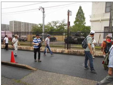
1189 さすがに戦車はデカイ