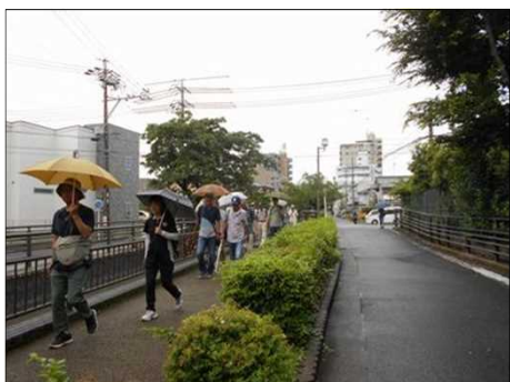
1190 守山自衛隊の外を巡る