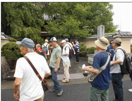
1213 折角だから境内を見学