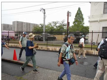
1186 フェンス越しに戦車が