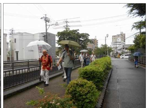
1179 東京暮しをご報告