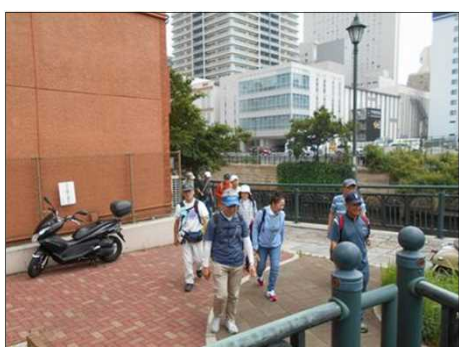
1135 堀川沿いの散策路を終わって