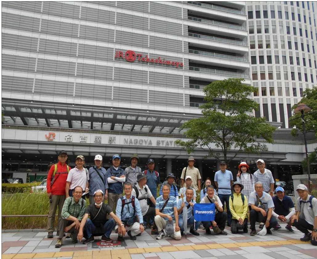
1082 JR名古屋駅、24名でスタート