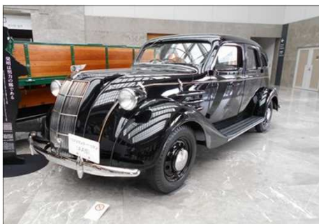
1085 トヨタ自動車 1号車