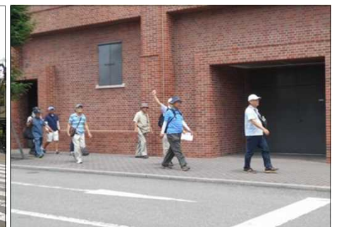
1088 煉瓦つくりの昔の工場