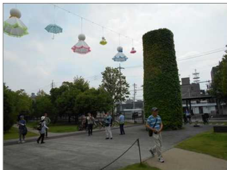
1098 ノリタケにてるてる坊主