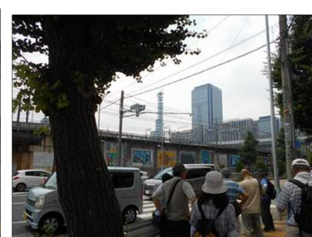
1141 ささしまライブに向かう