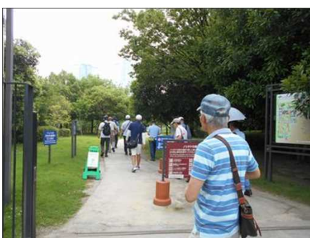
1092 リタケの森の入口で