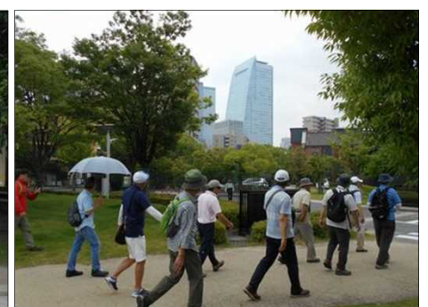
1095 都心のオアシス リタケの森