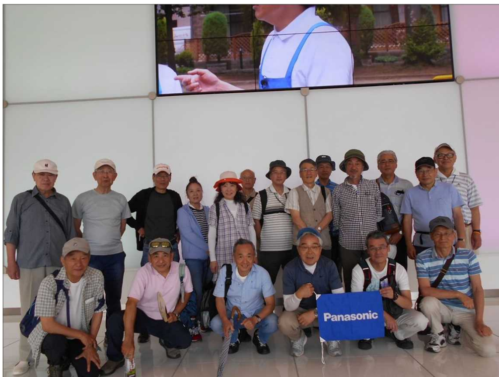
1146 無事元気にゴール！お疲れ様でした(中京テレビロビーにて)