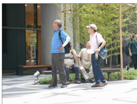
1144 中京テレビ前にて