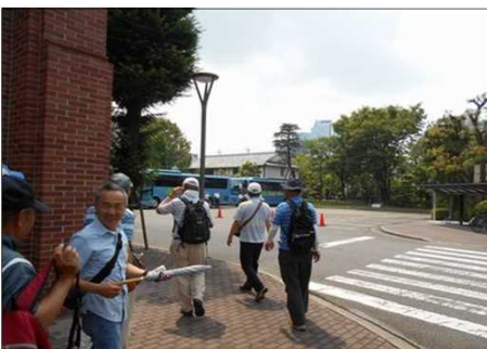
1086 トヨタを出てリタケへ