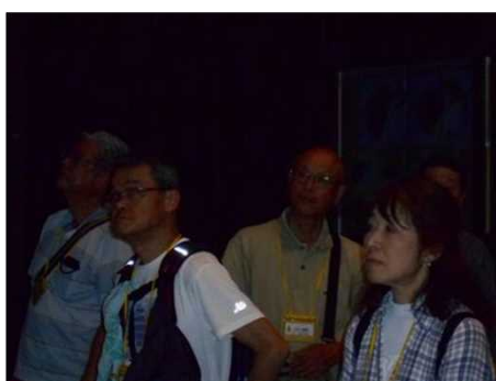
1149 キリンの説明を聴いているふり