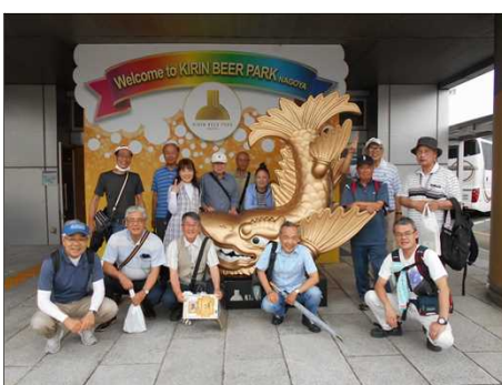
1156 キリンビール工場見学に参加