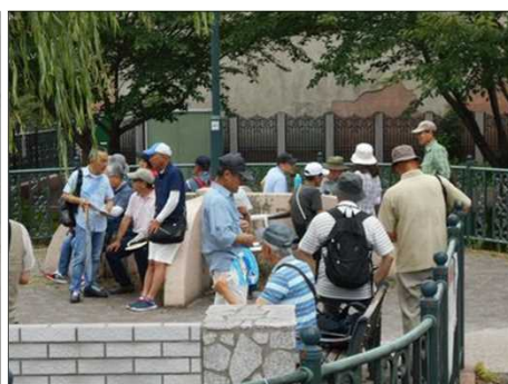
1126 堀川沿いの憩いの場所で休憩