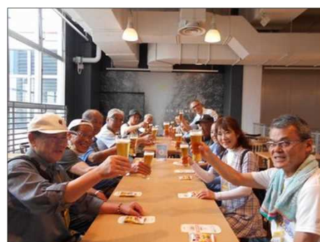
1152 キリンビールで乾杯！