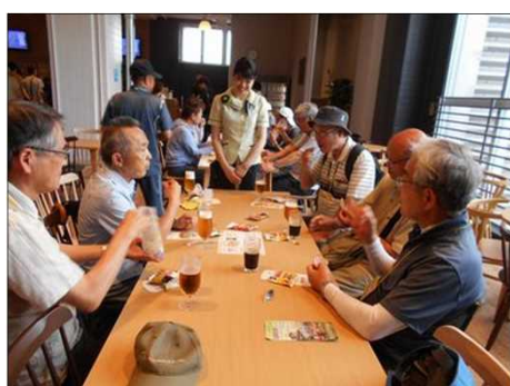
1154 やっと待望の出来立て生