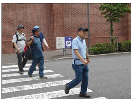
1091 元気よく歩き出す