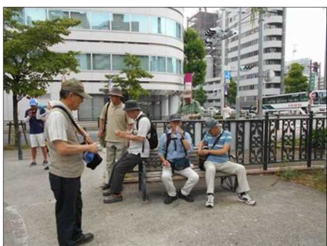
1124 暫しベンチで休憩