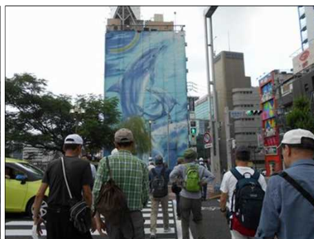
1132 ビルの側面に大きな絵が