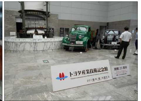
1084 トヨタ産業技術記念館にて