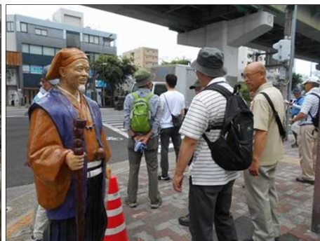
1109 黄門様？がありました