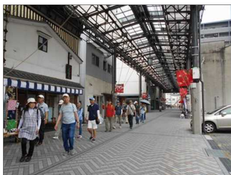
1112 歴史のある円頓寺商店街