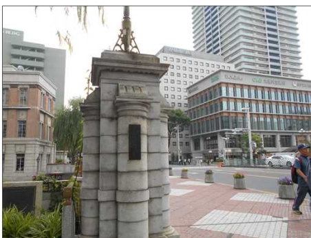
1131 堀川に架かる古い橋