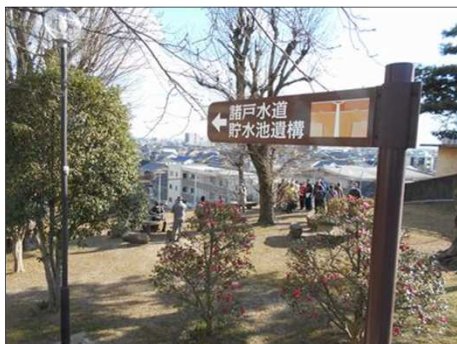
434 しっかり看板がありました