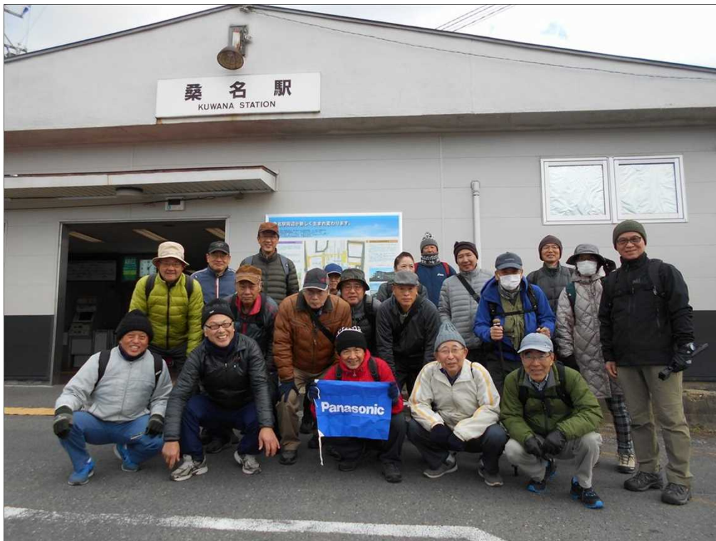
424 JR 桑名駅、21名で元気にスタート！