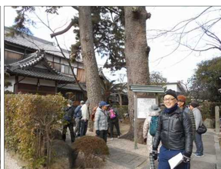
425 幹回りは大きかった