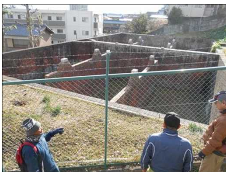
430 明治37年に完成した貯水池