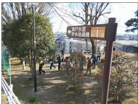
435 立派に公園が整備