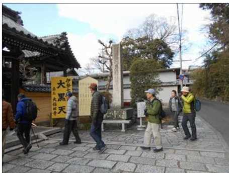
427 三重四国八十八カ所の一番札所