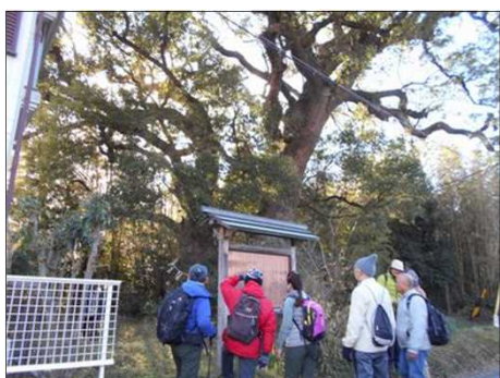
438 立て看板を見入る