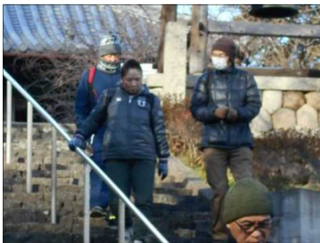
445 元気にゴールに向かう