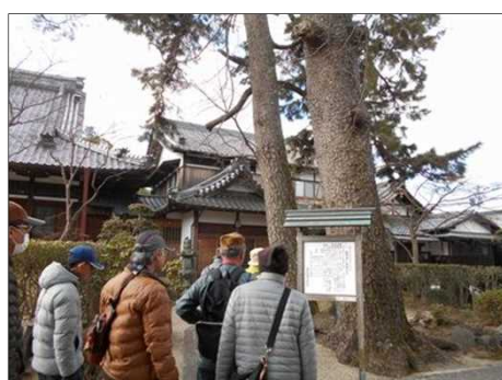
423 夫婦マツの照源寺