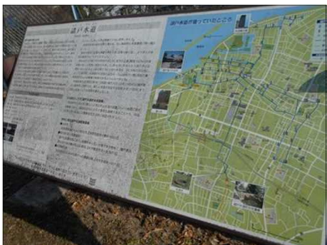
432 初代諸戸清六が個人資産で