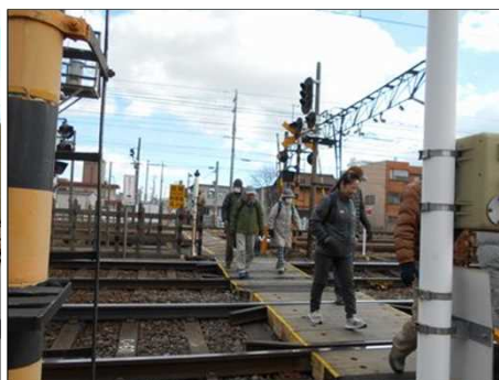
420 最後尾Gも渡りきる