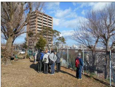
433 高台から長良川を観る