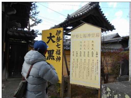
428 節分の準備も進む