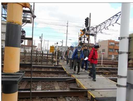
419 長めの踏切を渡る