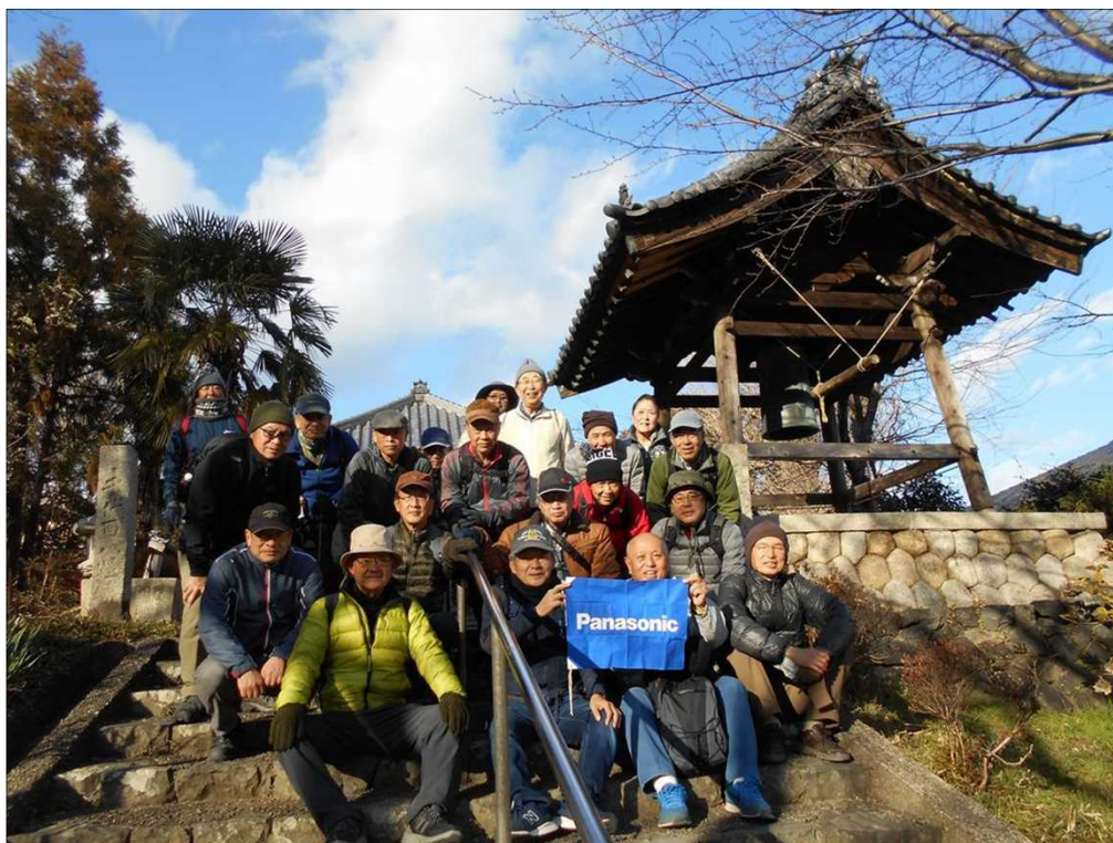
442 無事元気にゴール！お疲れ様でした(勧学寺前)