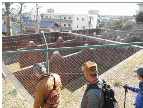
429 諸戸水道貯水池遺構を観る