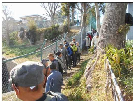
431 全国で7番目の上水道