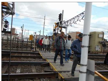
418 3つの幅の違う線路を渡る