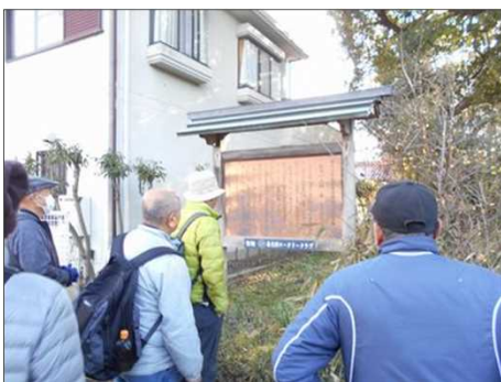
436 太夫の大楠を観る