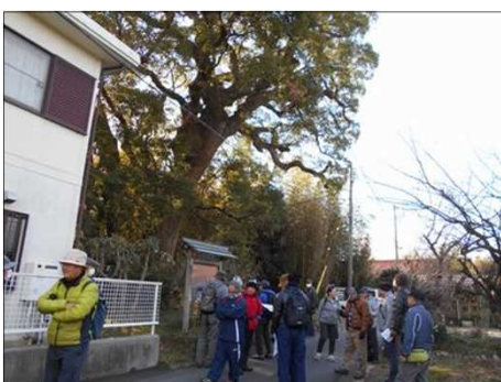
439 住宅街にひっそり建つ