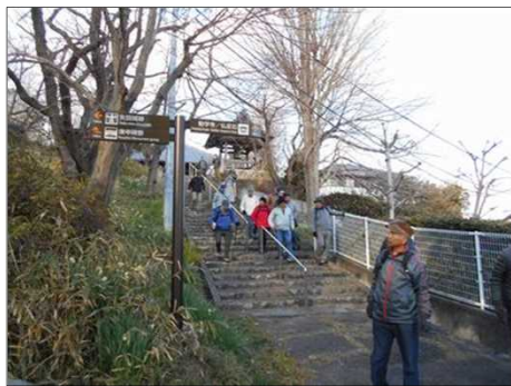
444 さあ 下りだ！