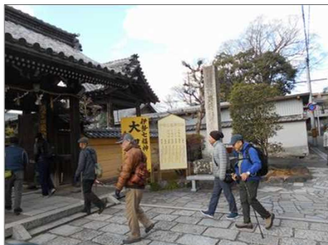
426 大福田寺を訪れる