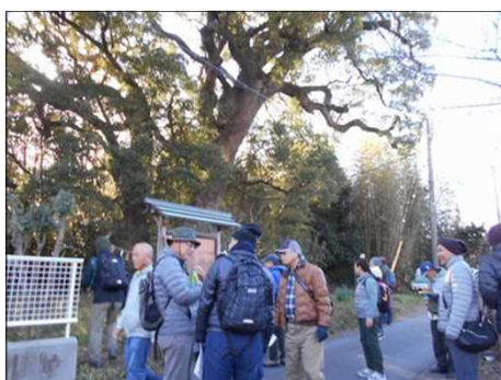
440 大楠は大きかった