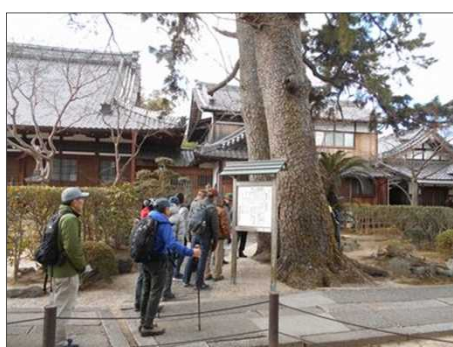
424 根は繋がっていました