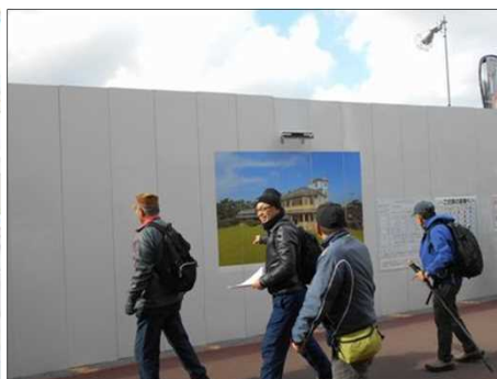
417 六華苑の看板を横目で見ると