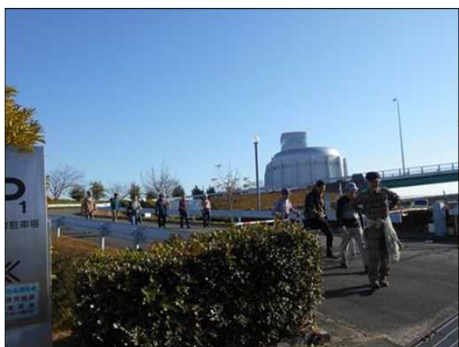
372 いよいよ伊勢大橋を渡る