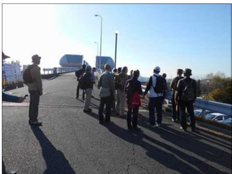
369 巨大な長良川河口堰