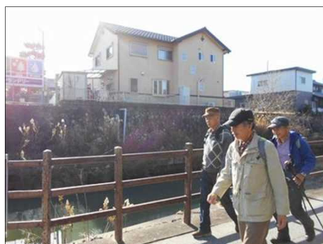
355 運河？沿いの遊歩道を進む