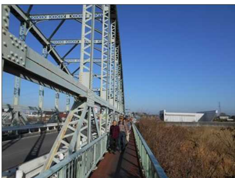
374 せまい橋の道で一人で歩く