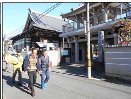
354 コンクリート造りの善明寺