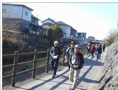
356 綺麗な遊歩道で歩き易いコース