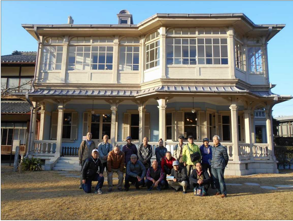
391 六華苑の庭でゴール写真を撮る。お疲れ様でした。