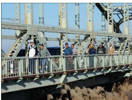
378 約1kmの伊勢大橋を渡る