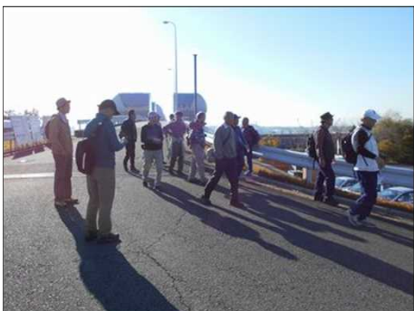
370 行き止まりの為コースを変更して進む