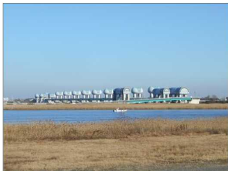
379 桑名から見た長良川河口堰