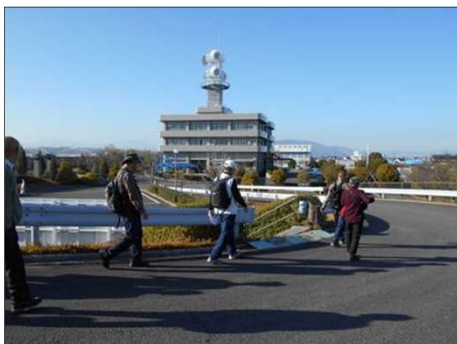
371 水資源機構の大きなビル