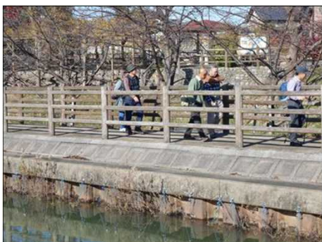
367 運河沿いを歩くのは気持ちいい