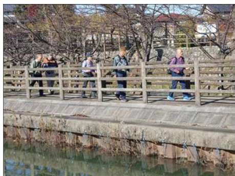
366 12月にしては暖かい日だった