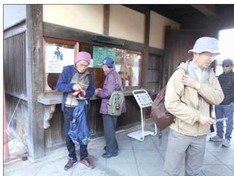
383 JAFのカードで割引して入苑