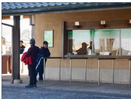
368 なばなの里の入口で