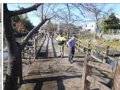
360 やすらぎパークで休憩