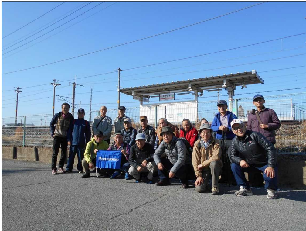
350 こじんまりしたJR長島駅到着、快晴の下、18名でスタート