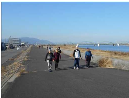
380 揖斐川の広い堤防を歩く