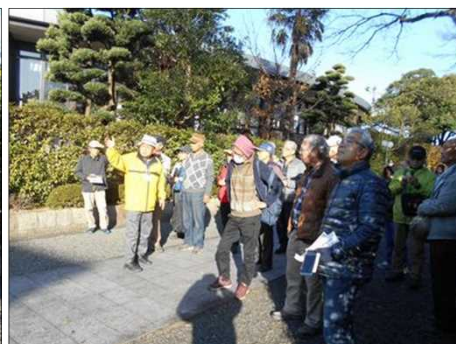
386 六華苑を教えて頂く