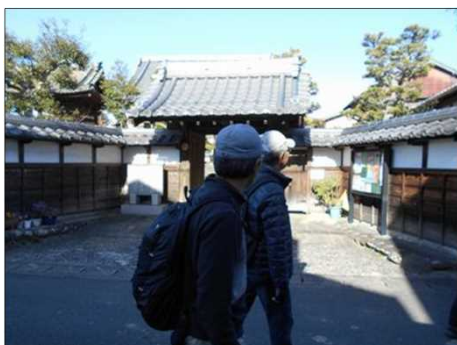
351 光岳寺の前を通過