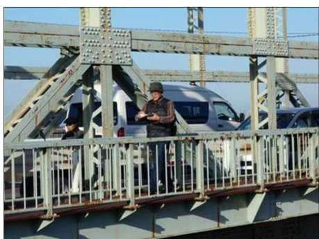
376 所々に錆びついた伊勢大橋