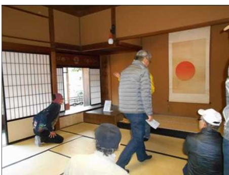
388 和館の座敷、天井が高い