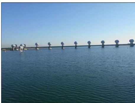
375 伊勢大橋から見る河口堰