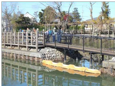
362 よく整備された休憩所