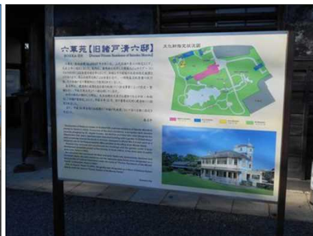
382 六華苑の説明看板