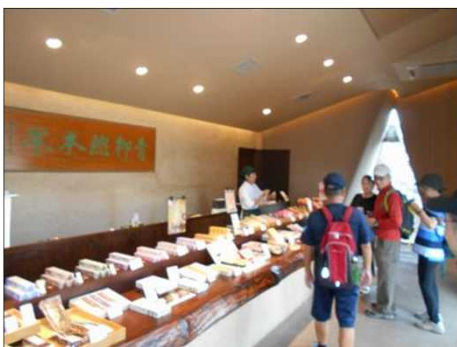
92 店舗内で、美味しそう！