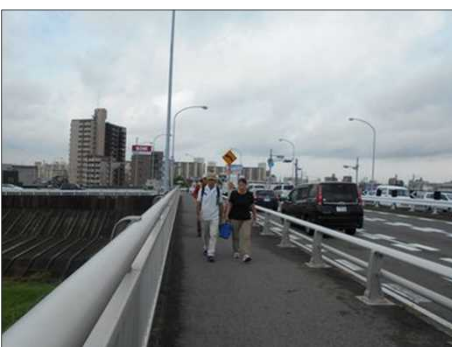
80 矢田川架かるに天神橋を渡る。