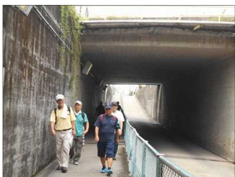
99 JR中央線の高架を潜る