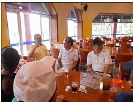
110 楽しい語らいのひと時