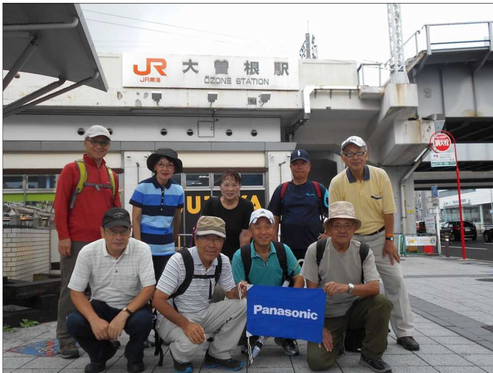
74 JR 大曽根駅を曇り空の中、元気にスタート