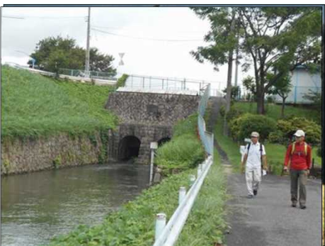
96 庄内川の水が堀川へ