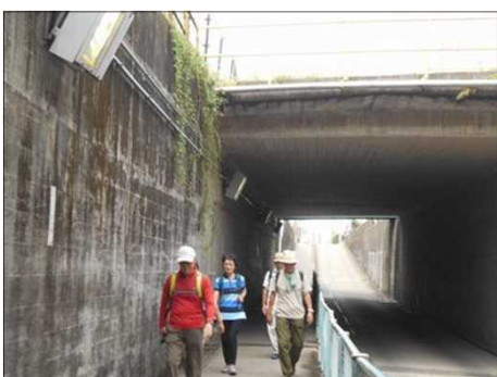
100 最後尾Gも無事通過