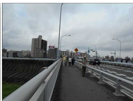
78 国道19で矢田川を渡る