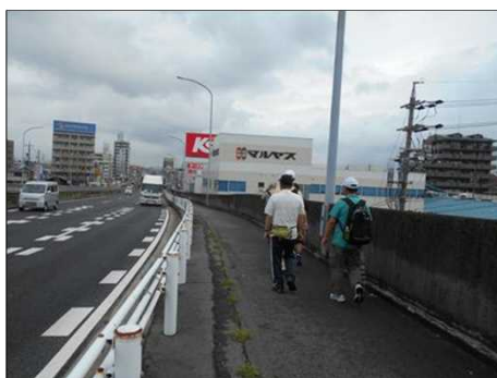
81 いよいよ橋を渡りきる