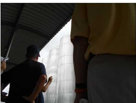
103 アサヒビールの大きなタンクです