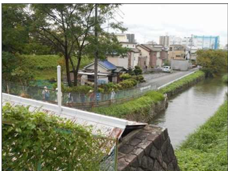
94 歴史感ある庄内用水元杵樋門にて