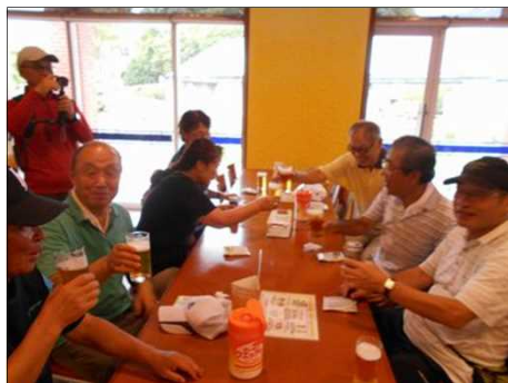
106 ビールで表情が和む