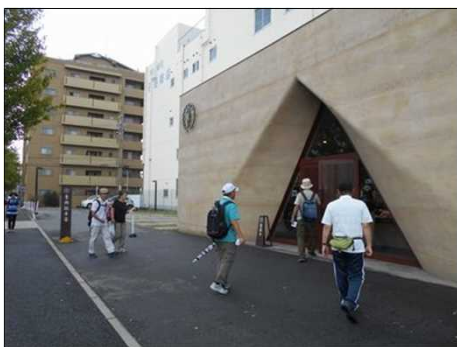
91 「青柳ういろ」に到着