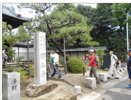
86 綺麗に整備された石山寺