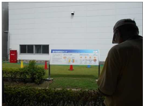
104 発酵中の大きなタンク