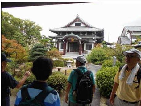
88 山門から境内を観る