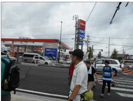
97 交通が多い国道19号に戻る