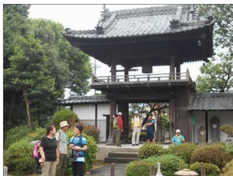
90 由緒ある二層になった山門