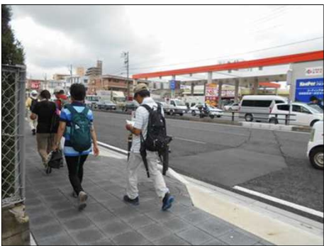
98 一路、ゴールの新守山駅に進む