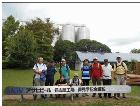
113 有志で見学記念撮影