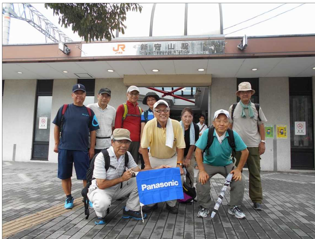
102 無事に10名全員、新守山駅に到着