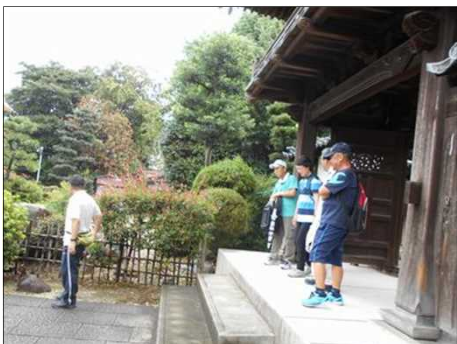
89 山門を潜ると別世界