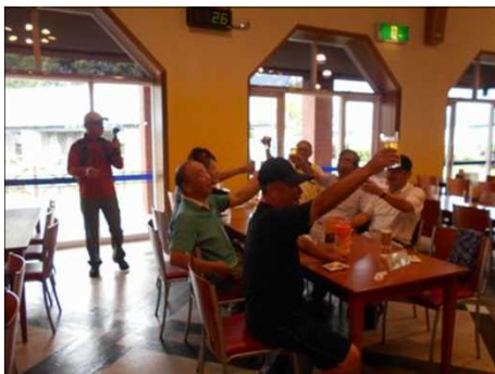
105 やっと至福の時間が来た！