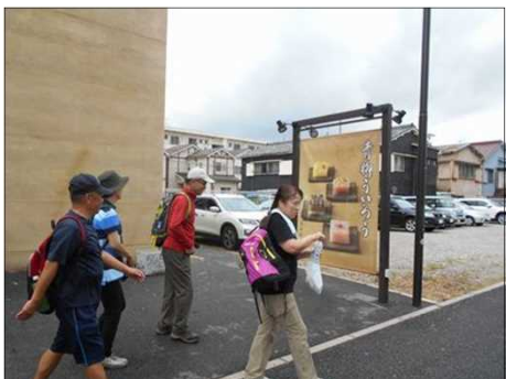
93 ひと休みして出発