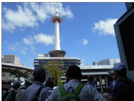
19 京都タワーがお出迎え