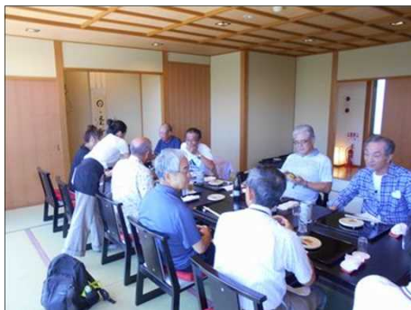
34 ゆったりと食事を楽しむ