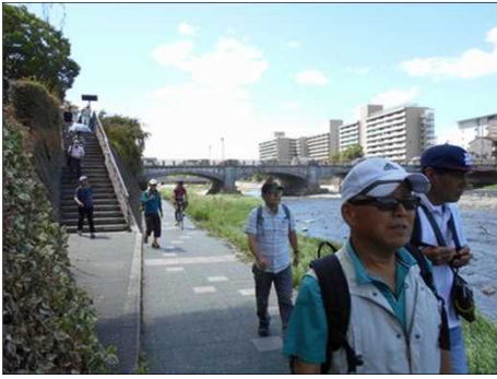
33 鴨川にはやはり鴨が居た