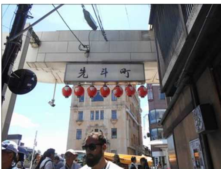
54 先斗町入口の看板