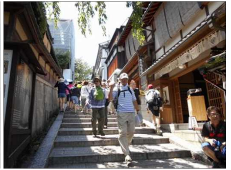
41 京都の情緒を味わう