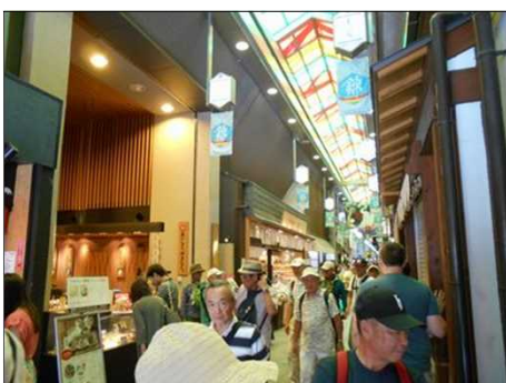
67 錦市場をそぞろ歩く