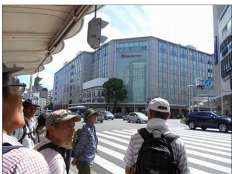
62 四条烏丸の高島屋前