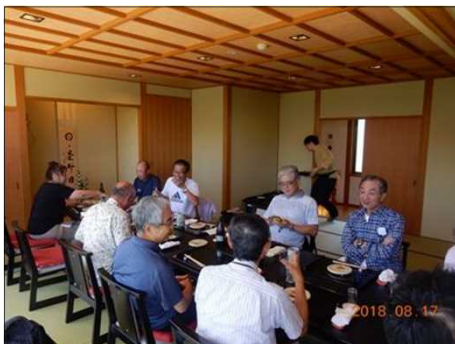
6003 雑談しながら戴く