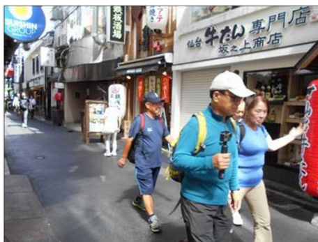
61 美味しい京懐石戴いて元気に