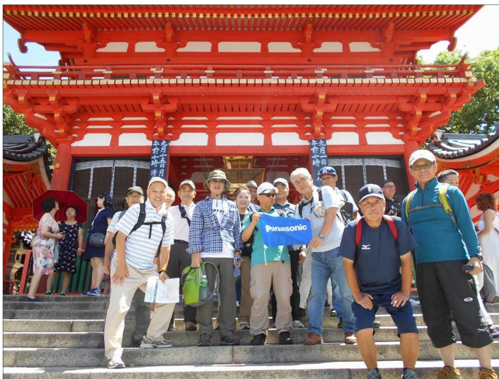
48 八坂神社の西楼門で