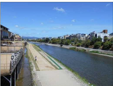
52 料理屋の川床が並ぶ