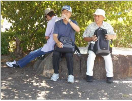
30 木陰でお茶タイム