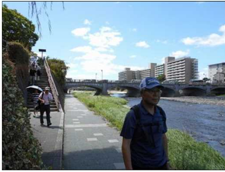
34 川面を見ていると涼しくなる