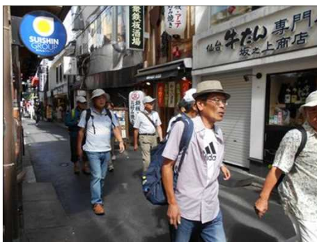
60 京都の町中を歩く