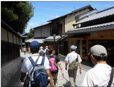
45 観光地を練り歩く