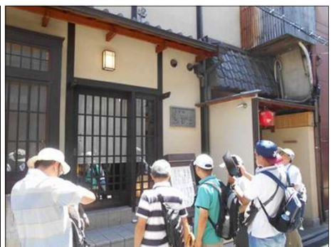
55 「多から」の玄関で待つ