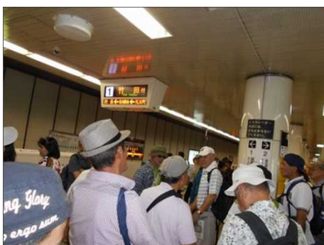
70 京都の地下鉄構内にて