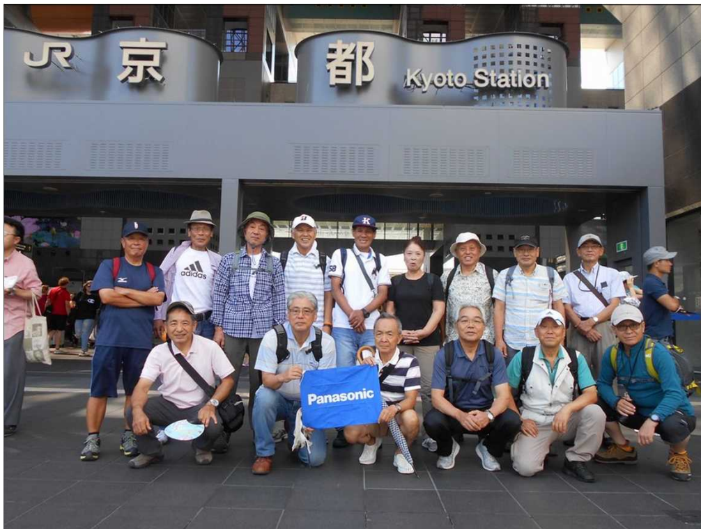
16 JR 京都駅を16名でスタート