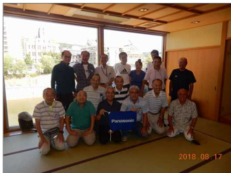
6011 京料理の「多から」にて全員写真