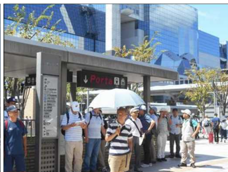
21 信号待ち、木陰で待つ