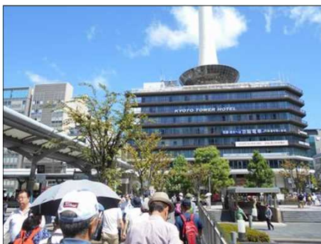
20 人ごみをかき分けて進む