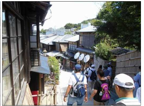
46 2年坂の石段を下る