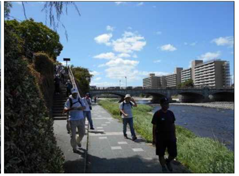
32 鴨川の河川敷を歩く