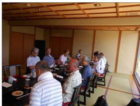
58 高級感あるお座敷での昼食