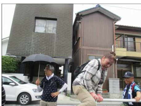
6682 ガードレールを越える！