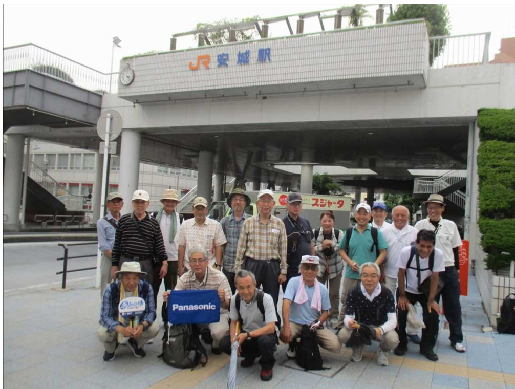
6700 全員、無事、元気にゴールのJR安城駅に到着