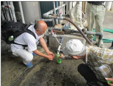
6696 酒用地下水をペットボトルに