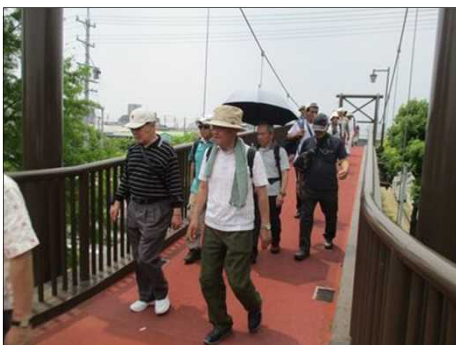
6664 まだまだ序盤です