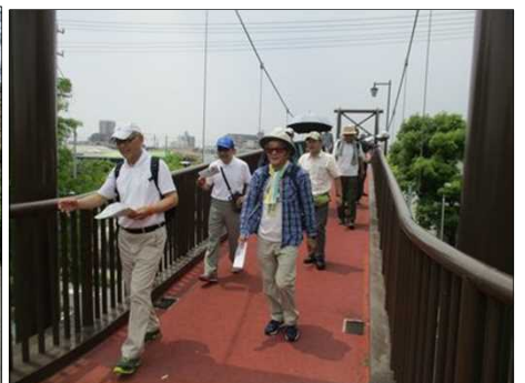
6663 綺麗な陸橋を渡る