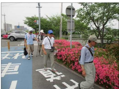
6674 満開のサツキの垣根を見て