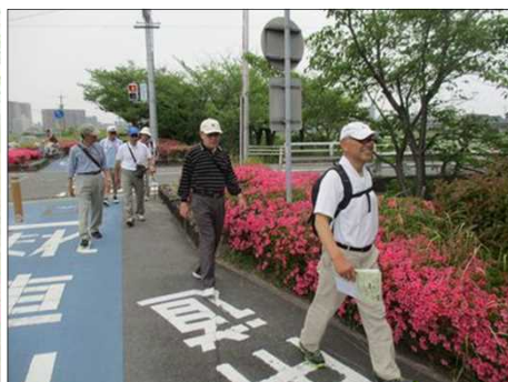
6673 綺麗なサツキを楽しむ