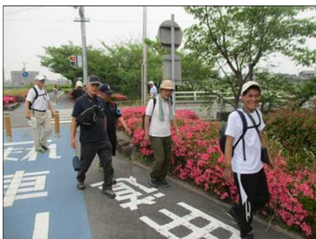
6672 紅赤色のサツキは美しい！