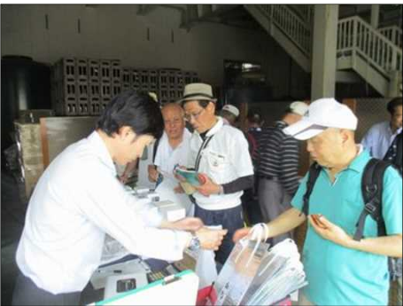
6694 生酒を買い求める