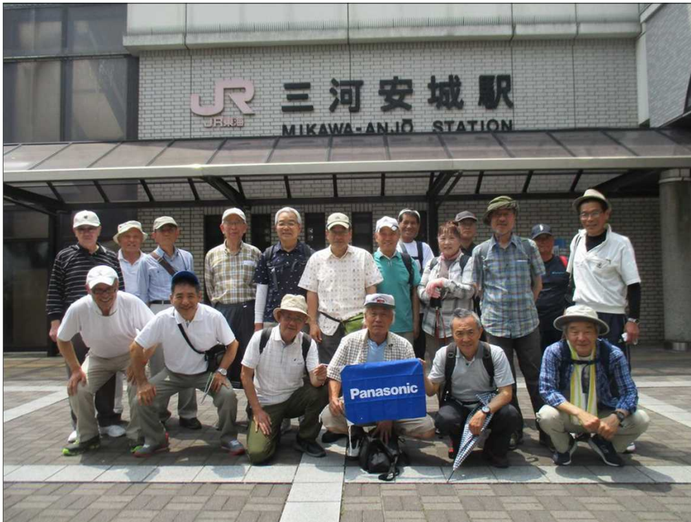
6659 JR 三河安城駅を20名で蒸し暑い中スタート