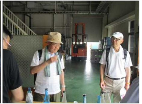
6692 各種の生酒を試飲！