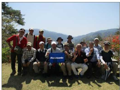
6497 妻籠城址で集合写真