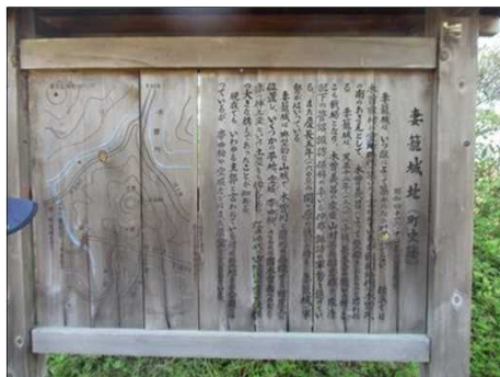
6493 妻籠城址の謂れを記す