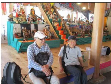
6502 5月人形が飾られていた