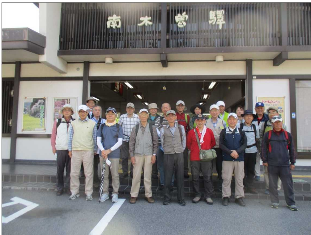
6476 JR南木曾駅を21名で元気にスタート