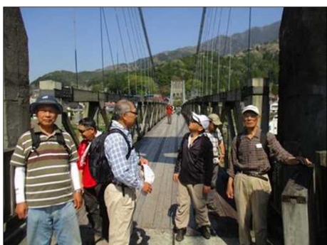
6523 桃介橋の途中の橋脚にて