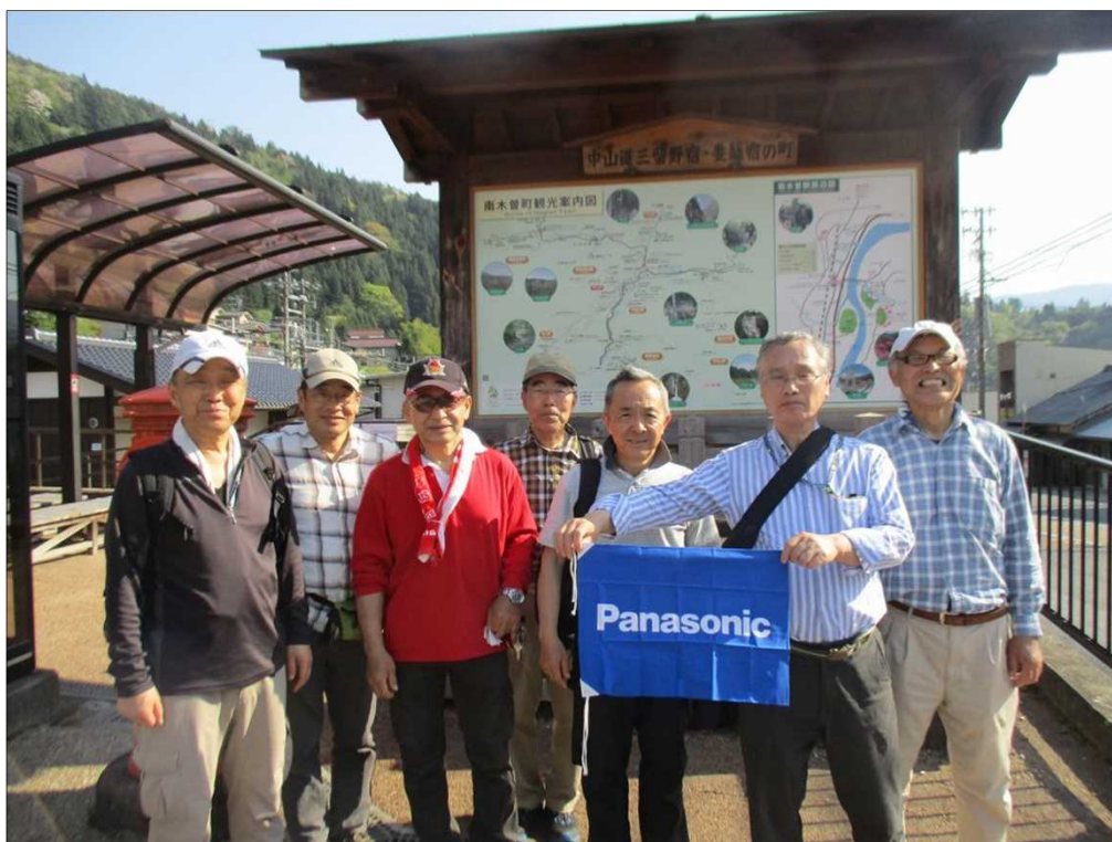
6528 無事、10kmを歩き切りました。お疲れ様でした。