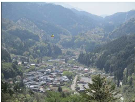
6495 眼下に妻籠宿を見渡す