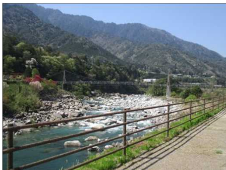
6517 木曾川に架かる桃介橋